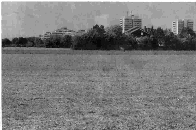
Der Protest der Bürger hat Erfolg gezeigt: Die Ausweisung von Wohngebieten am Bergwald, am südwestlichen Stadtrand, ist deutlich verringert worden.

Nachdem sich bereits Flächen für über 1000 Wohneinheiten in Genehmigungsverfahren befinden, entschieden sich die Stadträte nur für zwei neue Baugebiete: Auf dem Baywa-Gelände am Lohhofer Bahnhof sollen Geschosswohnungen entstehen, ebenso auf dem Erdbeerfeld. Die Baufelder N1 bis N4 am westlichen Ortsrand entfallen. Birgit Patsch, Vorsitzende des Bundes Naturschutz in Unterschleißheim, der an vorderster Front des Bürgerprotestes stand, war mit dem Ergebnis zufrieden und attestierte den Kommunalpolitikern, auf die Bürger rasch reagiert zu haben. Allerdings, vermutete sie, „in ein paar Jahren ist das Thema wieder da“.