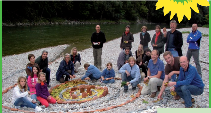
Der Ortsverband mit Freunden beim letzten Sommerfest an der Isar.

Energiewende statt Laufzeitverlängerung Seite 4