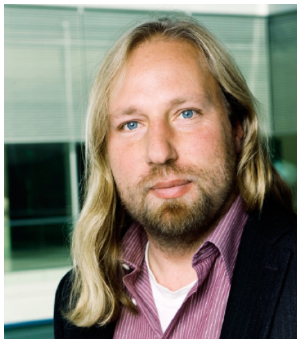
Toni Hofreiter, MdB